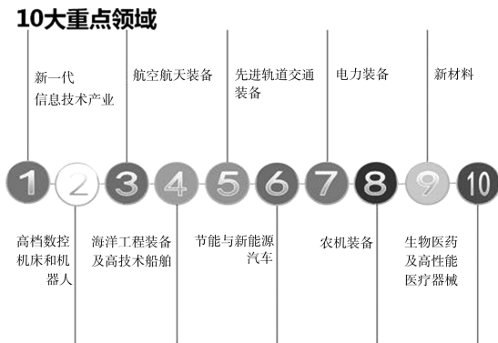
图 1-2 “中国制造 2025” 十大重点领域

如图 1-2 所示，十大重点领域为新一代信息技术产业、高档数控机床和机器人、航空航天装备、海洋工程装备及高技术船舶、先进轨道交通装备、节能与新能源汽车、电力装备、农机装备、新材料、生物医药及高性能医疗器械。